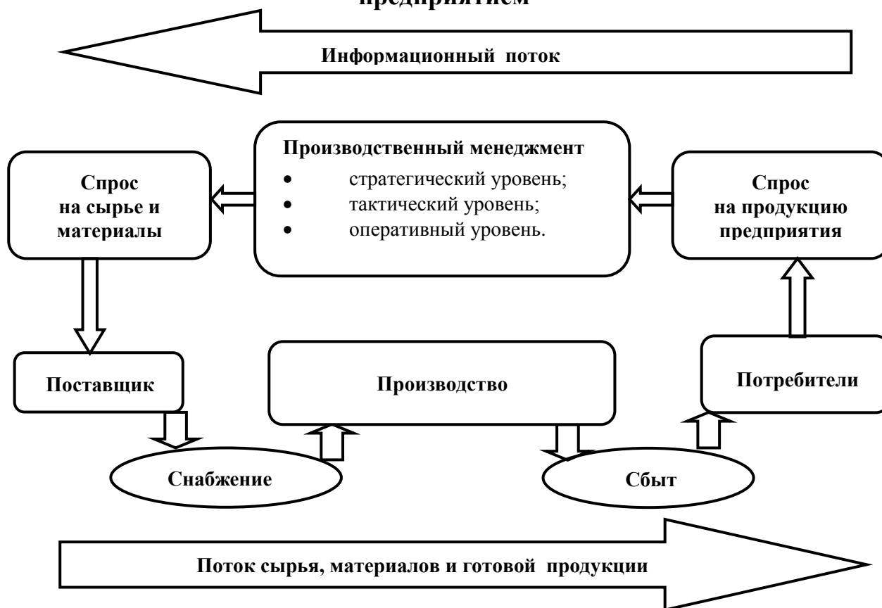
Рис. 1.1. Место производственного менеджмента в общей системе управления предприятием