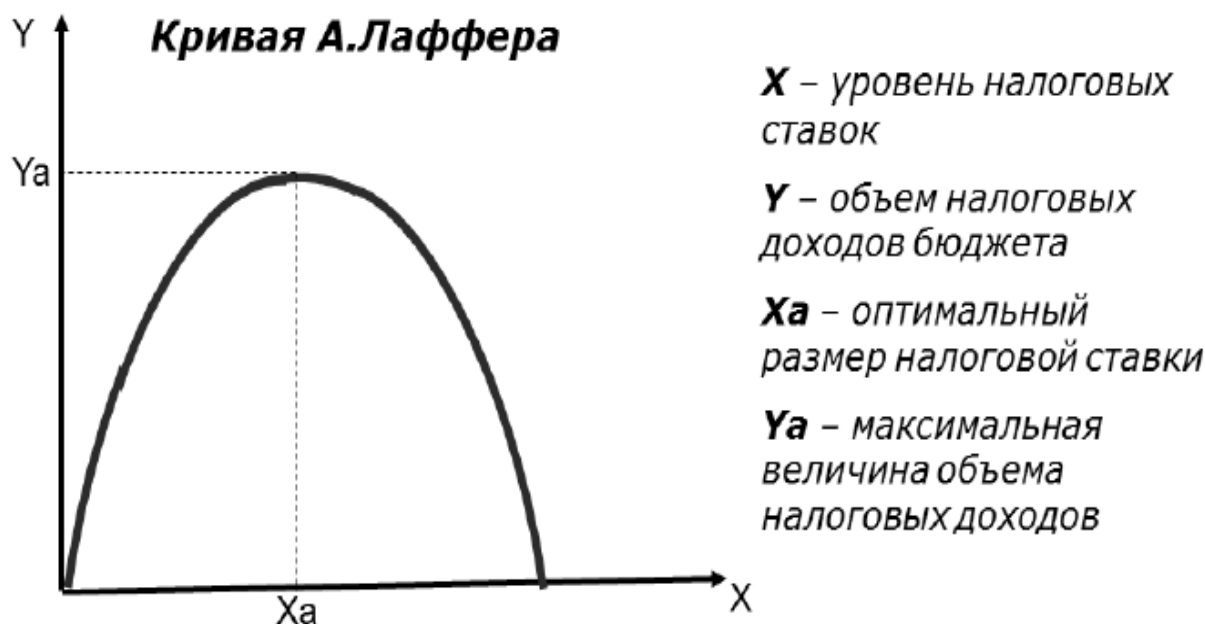
Рис. 2. Кривая Лаффера

Исследуя связь между величиной налоговой ставки и поступлением налогов в бюджет американский экономист Артур Лаффер показал, что повышение налогов может привести к снижению поступлений в бюджет. Смысл кривой в том, что снижение предельных ставок и вообще налогов обладает мощным стимулом воздействия на производство. При сокращении ставок база налогообложения в конечном счете увеличивается (выпускается больше продукции, доходы людей растут, растут налоги) (рисунок 2).